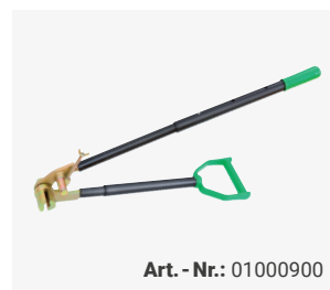
Art. - Nr.: 01000900