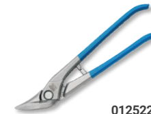
01252260 Idealschere rechts