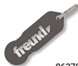
06370000 Freund Coin