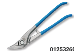
01253260 Idealschere links