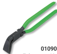
01090060 Falzzange 60 mm