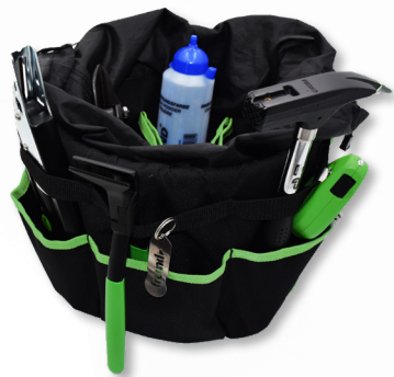
Art. - Nr.: 45184000

Starke Organizer: Verstaue und transportiere Dein Werkzeug-Set – Kombiniert mit einem Standard 12 Liter Baueimer!