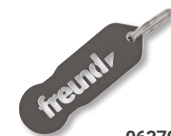
06370000 Freund Coin