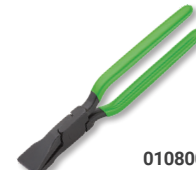
01080060 Falzzange 60 mm