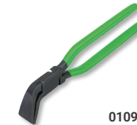
01090060 Falzzange 60 mm