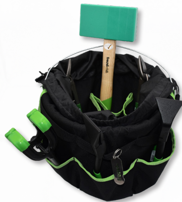
Art. - Nr.: 45186000