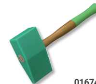
01674000 Deckhammer mit Finne