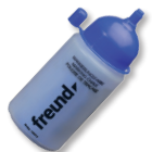
03050300 Markierungsfarbe blau