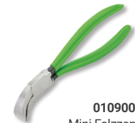
01090022 Mini Falzzange